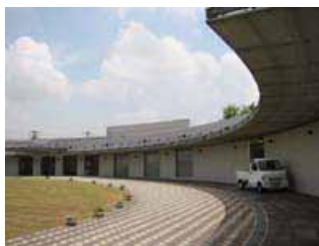
左：ふれあい塾 (葉祥栄：1994) 右：健康福祉総合センター (葉祥栄：1999)