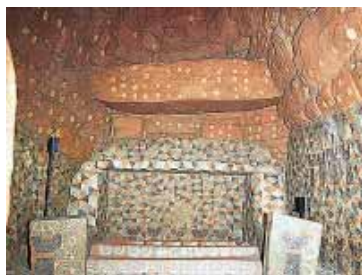
中：琴平文化館(1996) 右：田川市美術館(1991) 下：王塚装飾古墳館

今回見学予定の公共施設は建築作品として評価され、建築・デザインに関する賞を受賞しています。例えば、ふれあい塾(JDCデザイン賞奨励賞)、健康福祉総合センター(福岡県建築住宅文化賞優秀賞)、琴平文化館(ブルガリア世界建築トリエンナーレ入賞など)、田川文化エリア(日本建築士会連合会賞優秀賞など)。