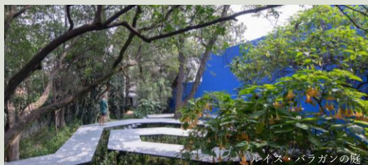
ルイス・バラガンの庭